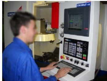
Technicien en réalisation de produits mécaniques