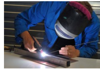
Technicien de Maintenance des Systèmes de Production Connectés