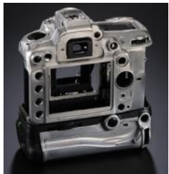
Boîtier d'appareil photo