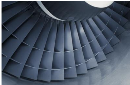
Aubes de turbine pour l'aéronautique

La fonderie est une industrie stratégique, soucieuse de l'environnement (recyclage des matériaux) qui recrute grâce au marché de l'aéronautique notamment.