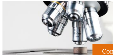
Contrôles en laboratoire