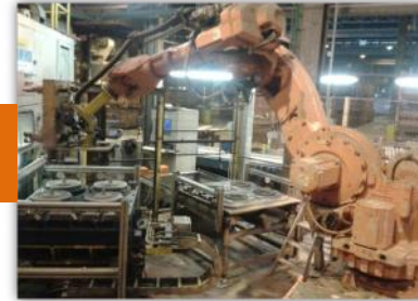
Conception de process