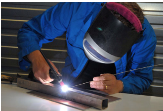
Technicien de Maintenance des Systèmes de Production Connectés