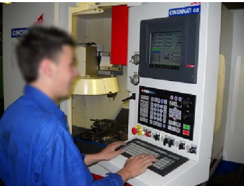
Technicien en réalisation de produits mécaniques