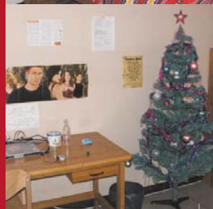
Chambre de l'internat