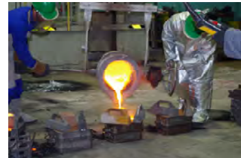
Coulée de l'alliage