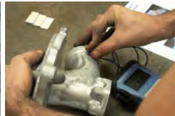
Contrôle non destructif