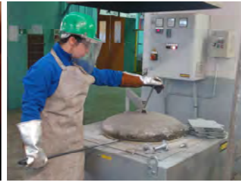
Préparation de l'alliage