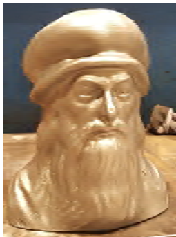
Secteur fonderie d'art